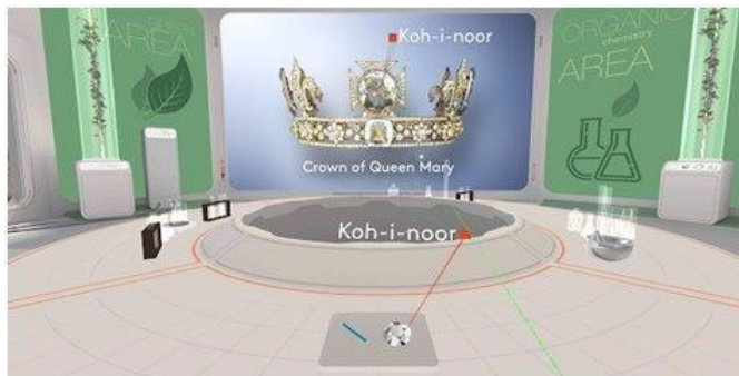
Рисунок 8. MEL Chemistry VR Уроки химии