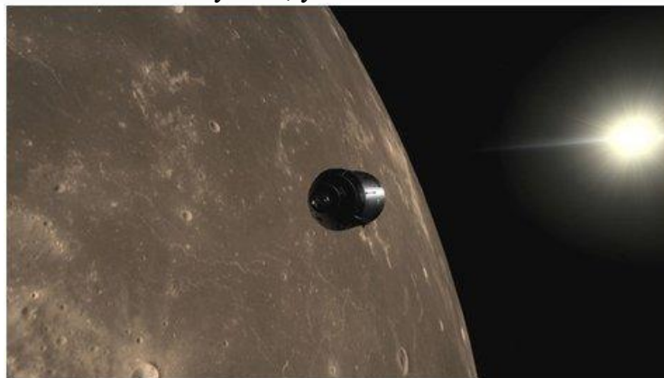
Рисунок 12. Apollo 11 VR

Titans of Space VR - обучающее приложение, которое позволит вам принять участие в экскурсии по Солнечной системе. Трёхмерные модели планет с детальной прорисовкой всех континентов и океанов, реалистичная анимация движения атмосферы Юпитера - одним словом такого вы не увидите даже в фантастических фильмах! Вдобавок к этому в течение всего полета нас будет сопровождать спокойная классическая музыка, усиливающая впечатление от увиденного.