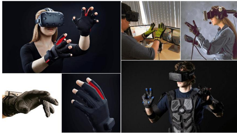
Рисунок2. Информационные перчатки.