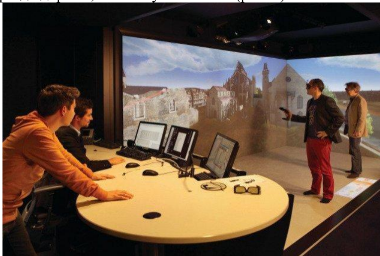
Рисунок 1. Комната VR.

Альтернатива для тех, кто не хочет испортить прическу — изображения в данном случае транслируются не в шлем, а на стены помещения, часто представляющие собой дисплеи Motion Parallax 3D (хотя для более полного UX в некоторых таких комнатах нужно надевать 3D-очки или даже комбинировать CAVE и HMD). Есть мнение, что VR-комнаты гораздо лучше VR-шлемов: более высокое разрешение, нет необходимости таскать на себе громоздкое устройство, в котором некоторых даже укачивает, и самоидентификация происходит проще благодаря тому, что пользователь имеет возможность постоянно себя видеть. Тем не менее, приобретение такой комнаты, понятное дело, выйдет гораздо дороже, чем покупка шлема (рис. 1).