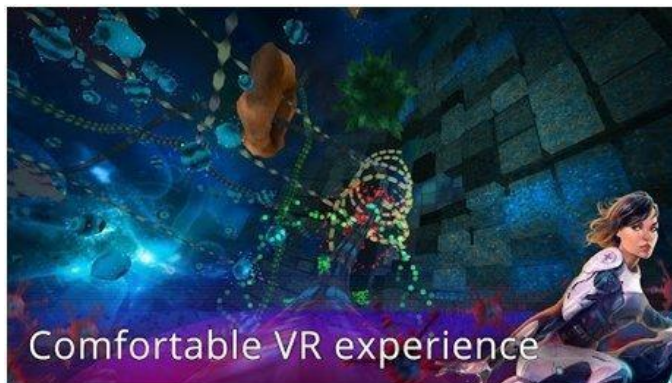
Рисунок 11. InCellVR (Cardboard)