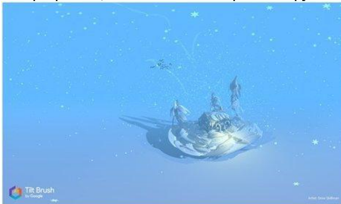
Рисунок 9. Tilt Brush

Даже если ребёнок не будет связывать свою дальнейшую жизнь с искусством, вполне вероятно, что к моменту, когда он будет получать профессиональное образование, проектирование в виртуальной реальности для многих специальностей станет обычным делом. К сожалению, VR-шлемы, необходимые для этой программы, всё ещё довольно дорогое оборудование (рис. 9).